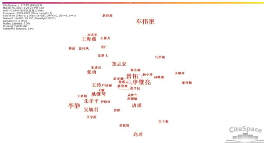
图1 中小学教师教学反思能力研究学者合作图