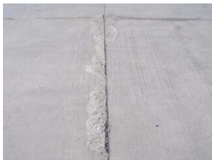
图1 接缝的掉边现象

在美国,扩缝倒角已作为强制规范推出。上海、北京、天津、成都、重庆等越来越多的国内大机场也对其跑道的道面切缝采用了倒角构造形式 [4] 。