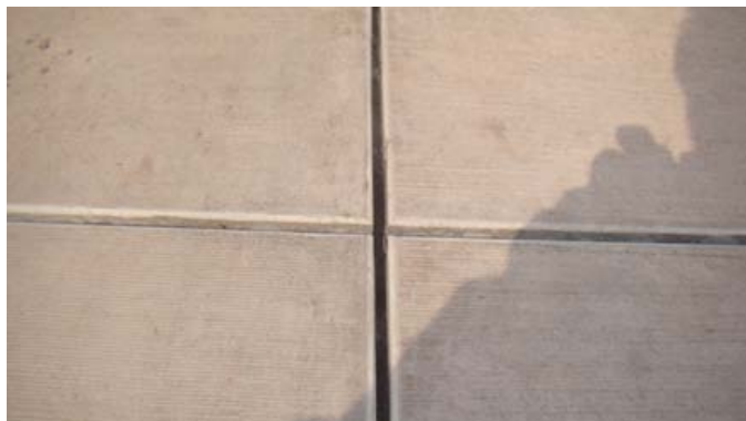
图 4 倒过角的道面

采取倒角措施后，能够有效减少道面使用中的接缝啃边、剥落等质量通病的发生，从而降低道面的日常维修费用。通过分析比较对华东某机场三跑道增加的施工成本和预计节约的维修费用，得出倒角工艺具有显著的直接经济效益。见表 3。