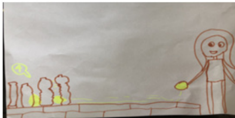
【游戏名称：鸡蛋保龄球】

关于斗蛋孩子们的兴趣渐渐开始消散，教师引导幼儿设计斗蛋游戏的新玩法，让幼儿结合自己对斗蛋游戏的经验进行经验的迁移运用，幼儿自由分组合作设计出新的斗蛋游戏。