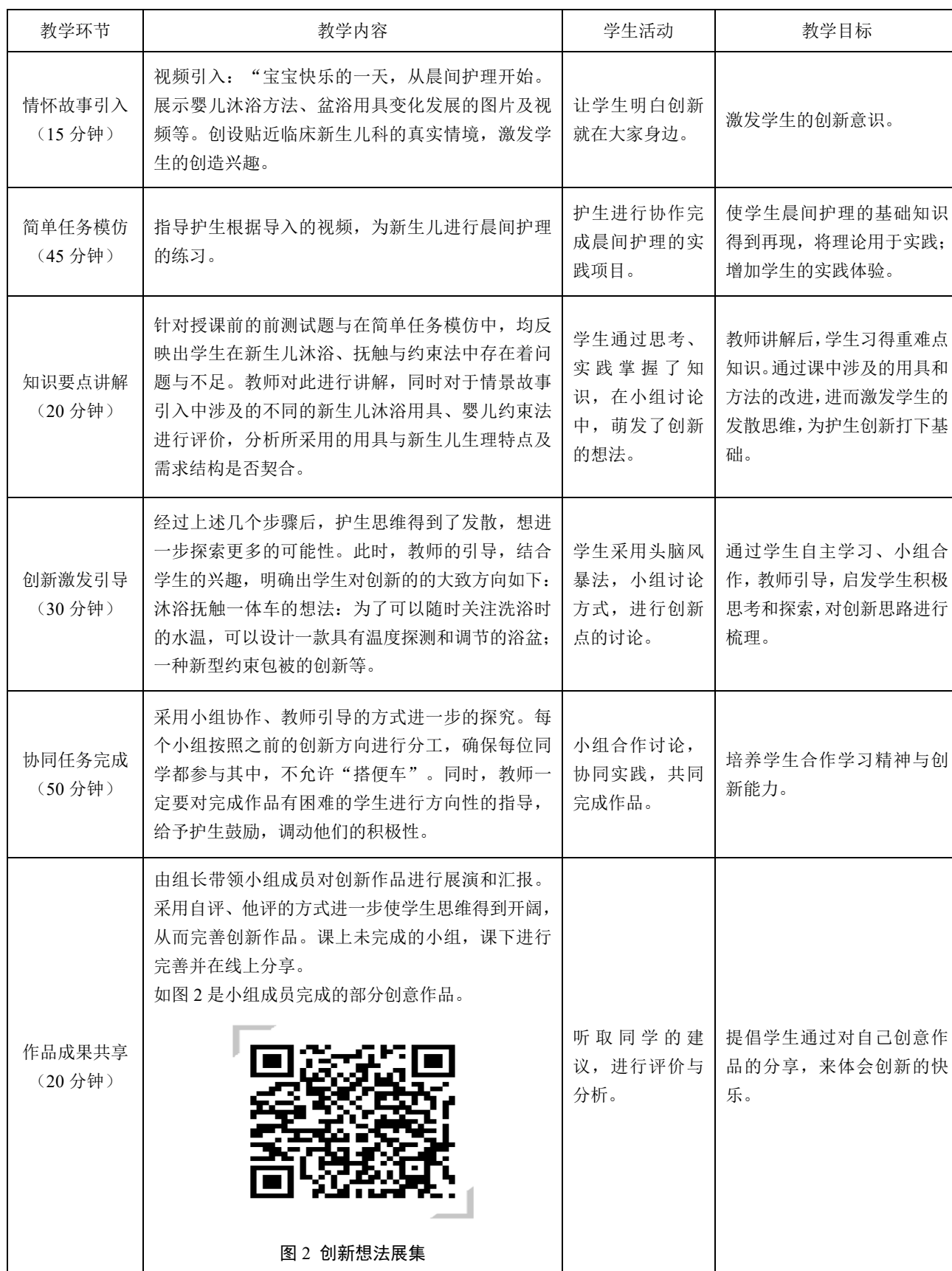
图 2 创新想法展集