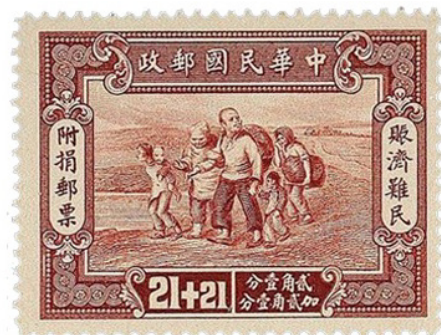
图 11 “赈济难民”附捐邮票