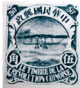
图3 飞机图普通邮票印样