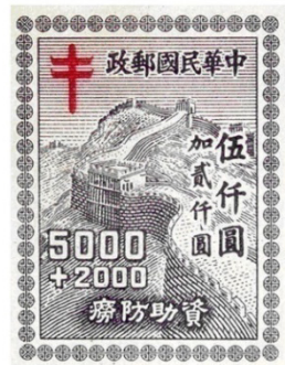
图 7 孙中山像金圆邮票 图 8 “资助防涝”附捐邮票