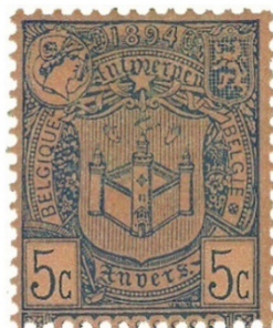
图6 比利时绿色5分票