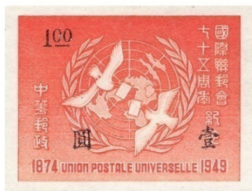
图 9 “国际联邮会七十五周年纪念”邮票