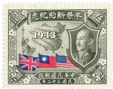
图 10 “平等新约”纪念邮票

由于邮政总局对先前邮票中的图案设计均不满意，1944 年发行的“赈济难民”附捐邮票便是特邀国立中央大学的吕斯百先生设计图案（图 11）。吕斯百师从徐悲鸿先生，当时声名已享誉美术界，吕斯百收到设计邀请后描绘出扶老携幼的一家六口背井离乡的逃亡情景，画家以高超的写实主义绘画技法将难民颠沛流离的情景表现的淋漓尽致、令人叹服，民国时期参与邮票设计的油画家仅此一例。