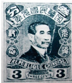
图2 孙中山像纪念邮票印样