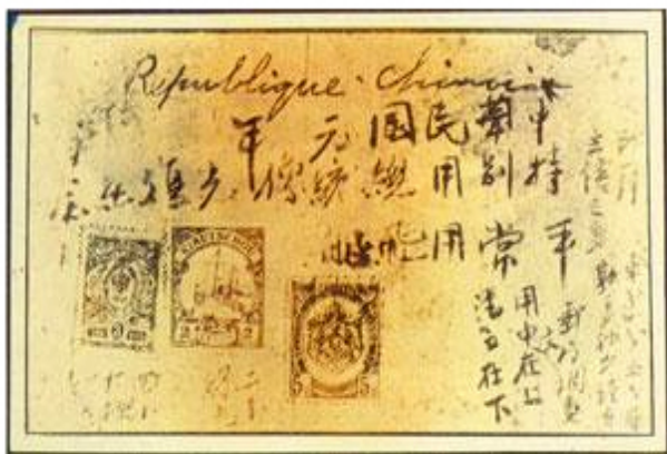
图1 孙中山会议笔记

中华民国成立后，南京临时政府决定发行新国家铭记的邮票并将此事提上政府的议事日程。1912年2月初，由孙中山主持的内阁会议决定设计并印制新邮票。当年会议上进行邮票设计的讨论过程记录在孙中山手书的一页笔记中（图1），“这页笔记的正面上部横写的四行内容是：法文‘Republique Chinoise’（中华民国）、‘中华民国元年’、‘特别用总统像’、‘光复纪念’、‘平常用飞船’等文字，均为孙中山手书……正面左下方贴有三枚外国邮票供作参考：左边一枚是俄国红色3分票；中间是德国在中国青岛‘租借地’发行的绿色2分‘胶州邮票’；右边是比利时绿色5分票；” [8] 这次会议决定设计、印制两套新邮票，一套是印有“孙中山像”的纪念邮票（图2），一套是印有“飞艇（飞机）”图样的普通邮票（图3），商务印书馆依据会议要求设计并印制样票。由于孙中山的手书记年代较久，笔记中的三枚外国邮票图像模糊不清，通过国外发行的邮票图册，运用图像比对的方法，确认这三枚外国邮票分别发行于1909年、1900年以及1894年（图4、5、6），清楚地还原了当时供作设计参考的外国邮票。从样票和参考的三枚外国邮票的图案设计可以看出，样票的构图与装饰元素更多地参照了德国在中国青岛租借地发行的胶州邮票。作为一国元首的孙中山先生躬身设计邮票，在中国邮票设计史中仅此一例，然而令人惋惜的是这两套邮票由于种种原因最终未能发行。